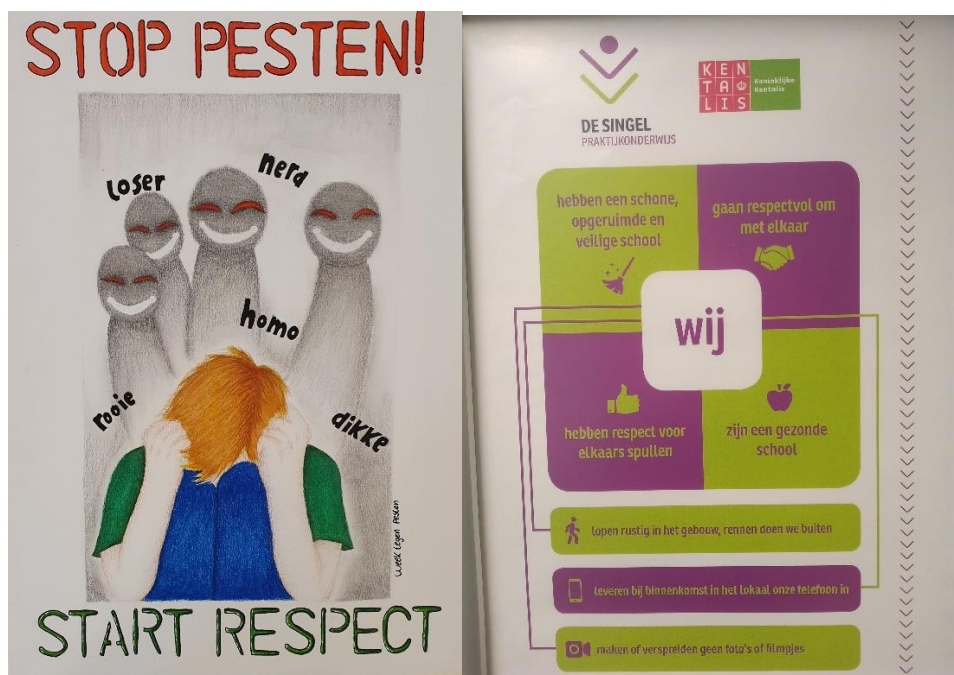
Onze "WIJ" poster voor rust en veiligheid

Incidenten die bij ons bekend zijn krijgen de aandacht die ze verdienen. Soms is dat met bestraffen maar meestal is het praten over (de invloed van) het gedrag voldoende om leerlingen te helpen om ander gedrag te laten zien. Heb je een onveilig gevoel op school? Praat er dan over met je mentor.