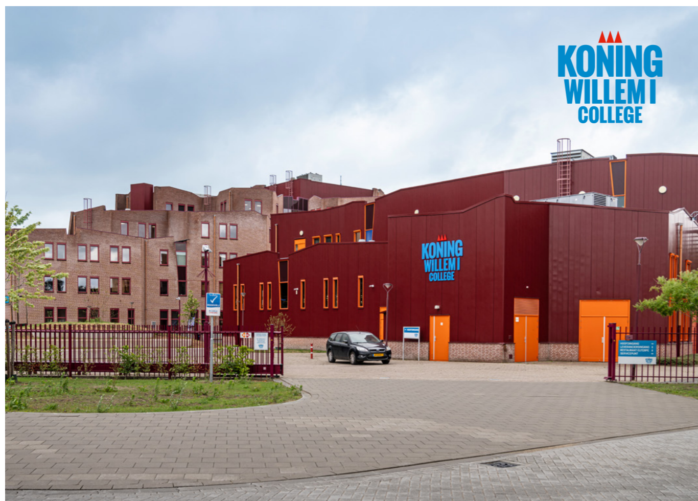
Locatie Koning Willem I College, Euterpelaan Oss

Wij wensen jou en je ouders/verzorgers een goede informatieavond!