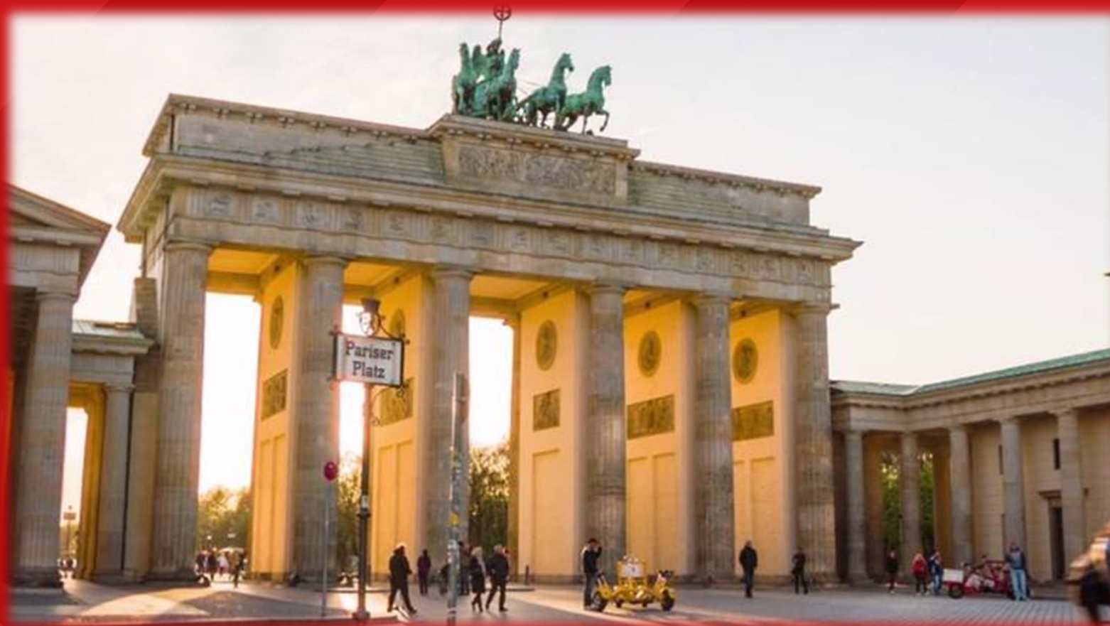
Das Brandenburger Tor