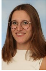
Celine Diels DLC