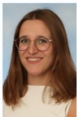
Celine Diels DLC

Leerlingcoördinator l.ceelen@hethooghuis.nl