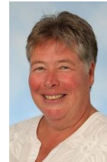
Toos ter Rele RLE

beeldende vorming m.dekruijff@hethooghuis.nl