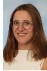
Celine Diels DLC