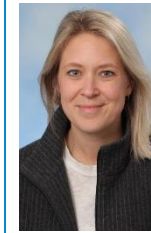
Yori Ysselmuiden YSS

Mentor M3E - lichamelijke p.verlegh@hethooghuis.nl